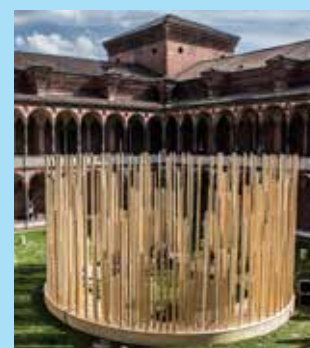
Il progetto sotto l'egida di Innova voleva offrire "una nuova idea di spazio pubblico"